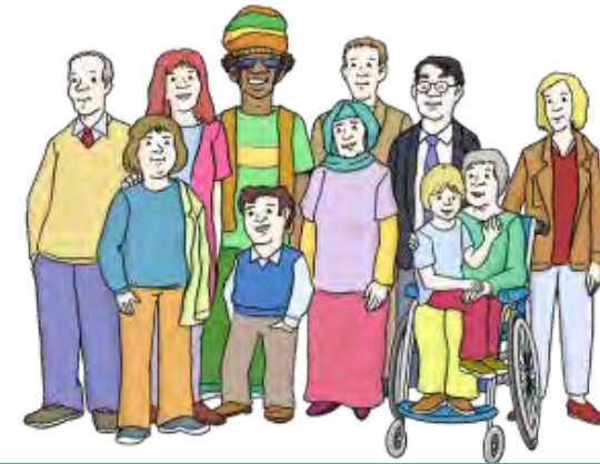
© Lebenshilfe für Menschen mit geistiger Behinderung Bremen e.V. Illustrator Stefan Albers Atelier Fleetinsel, 2013